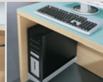
CPU-Halterung aus Metall zur Anbringung am Wangenfuß.