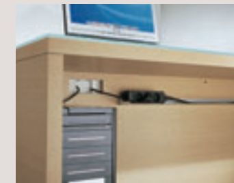
Horizontale Metallwanne zum Befestigen an den Sichtblenden

Besprechungstische mit Fußgestellen aus Stahl-Vierkanrohr, 60 x 60 mm, in 2 verschiedenen Maßen: quadratisch 120 x 120 cm, rechteckig 200 x 100 cm.