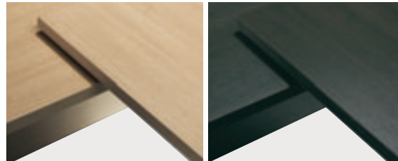
Weißer Eiche (CL)